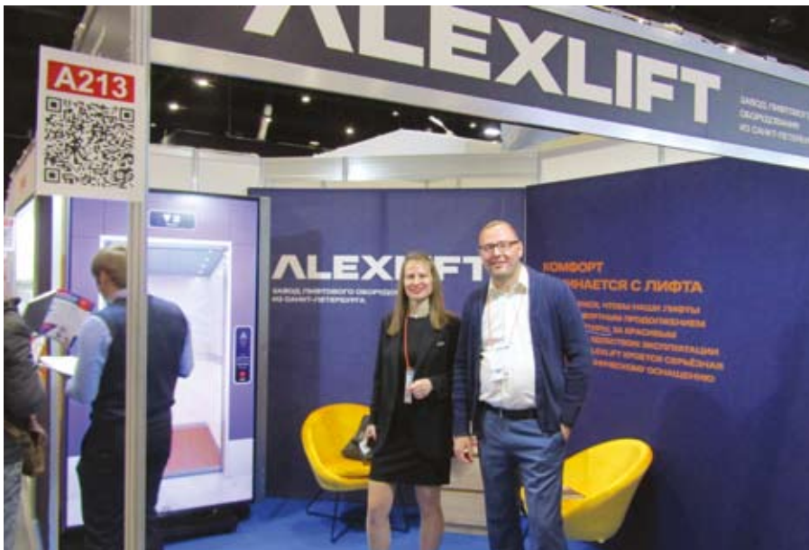
Стенд ООО «Alex Lift»

ваниям соответствующего технического регламента Евразийского экономического союза.